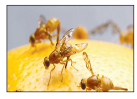
تحقیقات جدید نشان می دهد که مگس ها و سوسک ها احتمال انتشار کووید ۱۹ را ندارند.

مطالعات نشان می دهد: مگس ها و سوسک ها نقش ها گسترش کووید ۱۹ ندارند